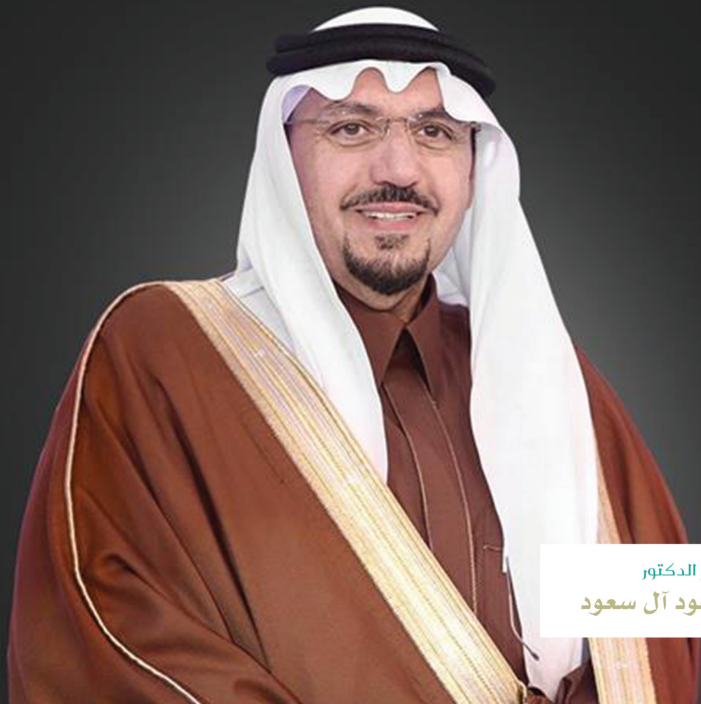
صاحب السمو الملكي الأمير الدكتور فيصل بن مشعل بن سعود آل سعود