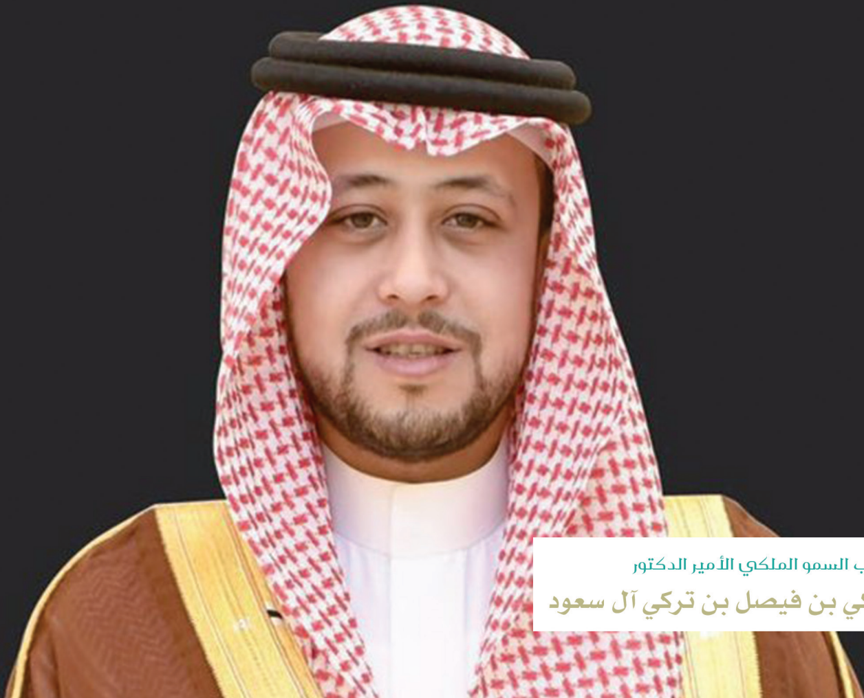
صاحب السمو الملكي الأمير الدكتور فهد بن تركي بن فيصل بن تركي آل سعود